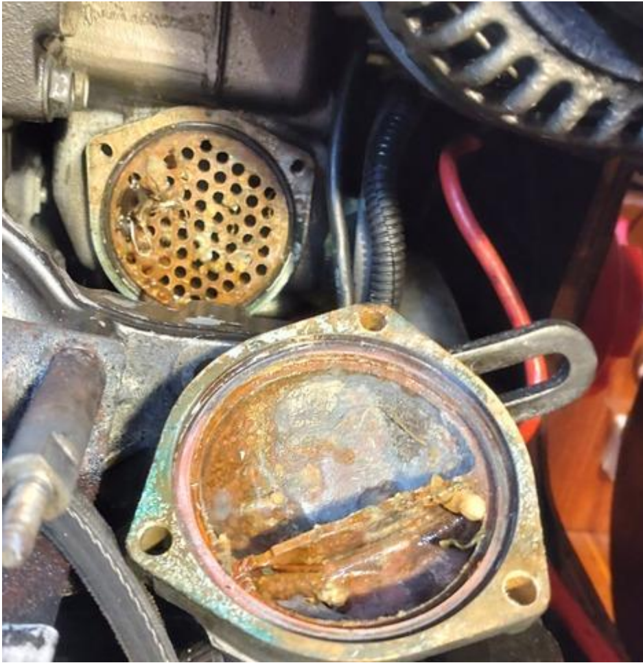
3本の六角ボルトを外せば、パカッと外れる、多少のゴミ、そして