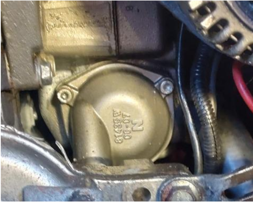
Generator が邪魔になるので Fanbelt を外し、上に移動